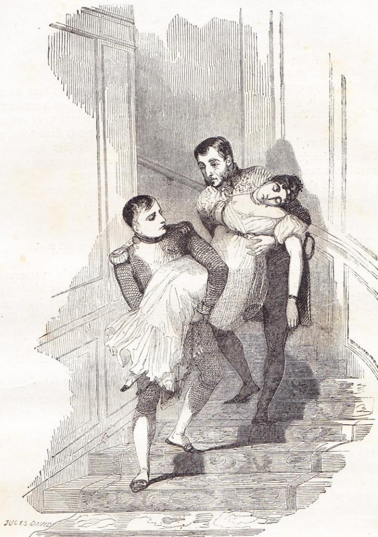
Doucement donc . Beussé! vous avez failli nous faire tomber les uns sur les autres. (Chap. VIII.)

tendant qu'on vint l'avertir de l'arrivée de l'empereur d'Autriche. La garde, à deux cents pas en arrière, était en bataille, l'arme au bras; les soldats avaient suivi l'exemple du Petit-Caporal , et marquaient le pas pour se réchauffer les pieds. On ne tarda pas à annoncer le monarque autrichien, qui arriva, lui, dans une bonne berline bien close. Il était accompagné des princes Jean et Maurice de Lichtenstein, des généraux Kienmayer, Bubna et Sutterheim, ainsi que de plusieurs officiers supérieurs de hulans qui s'étaient joints à une escorte de hussards hongrois. Celle-ci, de même que l'escorte des guides, resta à deux cents pas du lieu de l'entrevue. Napoléon alla à pied à la rencontre de l'empereur François, et l'embrassa en l'abordant. Le prince Jean de Lichtenstein suivit son souverain jusqu'auprès du feu de Napoléon, et y resta pendant toute la conférence. Le maréchal Berthier